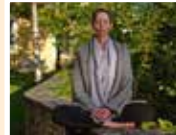
Meditationslehrer- Ausbildung und Meditationslehrer- Weiterbildung