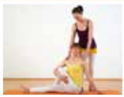
Weiterbildung Asana Exakt