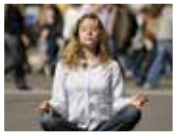
Weiterbildung Yoga und Stress Management